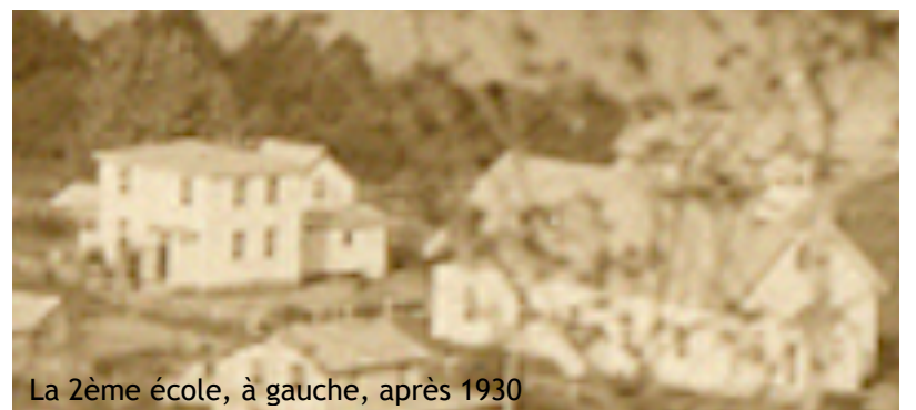
La 2ème école, à gauche, après 1930

Le 21 janvier 1937 , Mgr Joseph-Eugène Limoge, évêque du diocèse de Mont-Laurier, érige en paroisse Notre-Dame-de-la-Sagesse du Lac-des-seize-Îles ce qui jusque là n'était qu'une desserte.