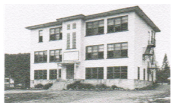
École construite en 1950

Dès la fin de l'année scolaire en 1950 les travaux de construction commencèrent. En février 1951 , les religieuses et les élèves entrent dans le nouvel édifice qui tient lieu de couvent et d'école. En 1952 , on commence à parler d'agrandissement, car on compte 61 élèves. Ce sera fait en 1959 alors qu'on ajoutera deux classes .