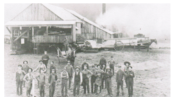
Les deux illustrations à droite montrent des travailleurs du moulin à scie de Duncan vers 1912