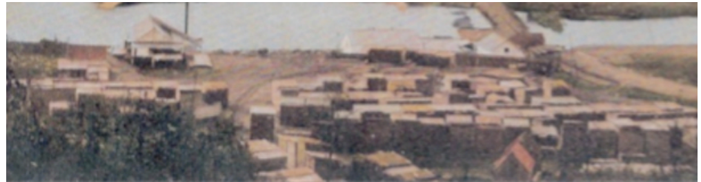
Sur cette photo d'époque, on peut observer à gauche le moulin à scie, à droite les hangars et la gare de train, au centre, la cours à bois.

Un second moulin à scie, dit le moulin à Duncan , était fonctionnel autour des années 1910. Le moulin et sa cour à bois étaient installés sur l'emplacement de l'actuel stationnement municipal, tout près de la descente de bateau.